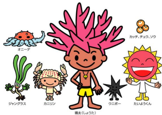
イメージキャラクター「礁太くん」と仲間たち