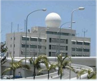
南大東島地方気象台