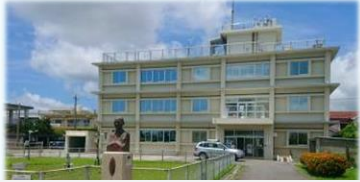
石垣島地方気象台