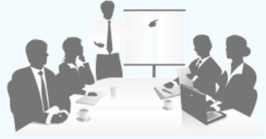
宮古島地方気象台